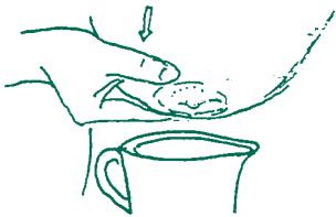
Thực tập sẽ giúp nặn sữa dễ hơn