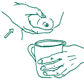
Kẹp ngón cái & các ngón tay vào nhau