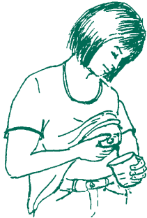
Đè vào phía lồng ngực

Nặn sữa bằng tay cần thì giờ để học cách nặn. Dần dần quý vị sẽ làm được. Xoa bóp vú và đắp nước ấm sẽ giúp dễ nặn. Trước khi nặn sữa hãy giữ cho người được thoải mái.